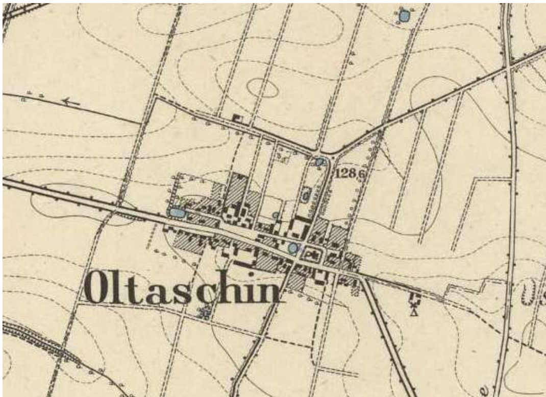
centrum dawnej wsi

Ze zrozumiałych względów najstarsze informacje o wsi pochodzą z zapisów dotyczących spraw własnościowych – w naszym przypadku dóbr kościelnych.