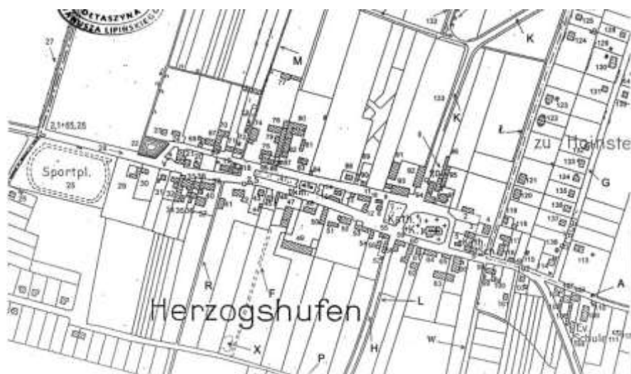
szkic centrum z okresu przed II wojną światową

Najstarszy znany zapis dotyczący wsi powstał w roku 1204. Dokument ten stwierdza, że książę Henryk I Brodaty nadaje klasztorowi NMP na Piasku 10 grzywien z dochodów swojej mennicy we Wrocławiu oraz zwalnia wsie klasztoru od podworowego (rodzaj daniny). W grupie tych wsi odnotowano Oltanschino. Zaginiony oryginał dokumentu znajdował się w klasztorze Augustianów na Piasku.